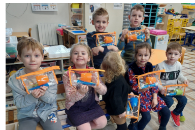
Sensibilisation au brossage des dents

Ecole primaire publique 6 place du château d'eau à Vingt-Hanaps 61 250 Ecouvès 02.33.28.63.76 / ce0610688s@ac- normandie.fr