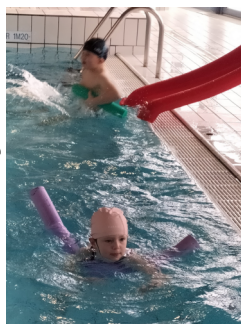
Les GS et CP à la piscine