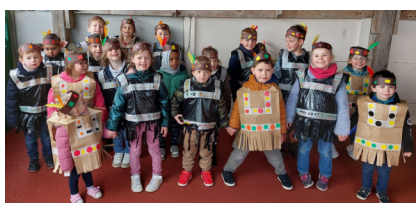
Le carnaval des indiens