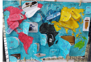
Les productions pour le Salon